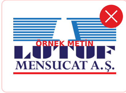
Logo üzerine yazı yazmak