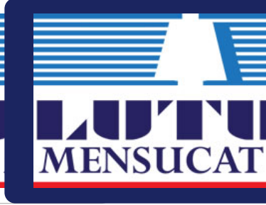
Beyaz / Lacivert zemin