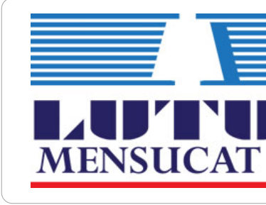
Lacivert / Beyaz zemin

Tek renk baskı gerektiren durumlarda logo tümüyle lacivert veya siyah olarak kullanılabilir.